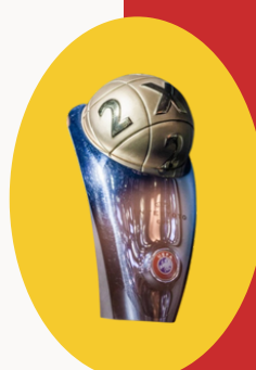
Pjesëmarrje në UEFA Kupa Intertoto (x1)