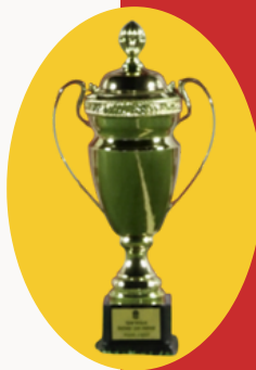
Kategoria e Tretë (x2)