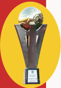
Kategoria e Parë (x5)

Përmes këtyre vlerave, KF Bylis synon të kontribuojë në zhvillimin e futbollit shqiptar dhe në ndërtimin e një identiteti sportiv të fortë dhe të respektuar.