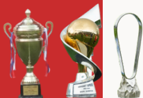
"U19" : Kampion Kategoria e Parë - Superiore & Pjesëmarrje në UEFA Young League