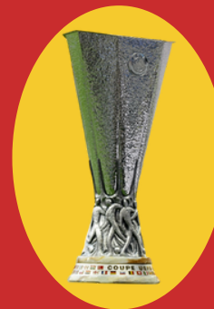
Pjesëmarrje në UEFA Liga e Evropës (x1)