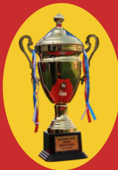
Kategoria e Dytë (x2)