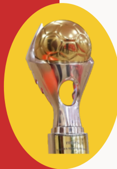
Finalist i Kupës së Shqipërisë (x1)